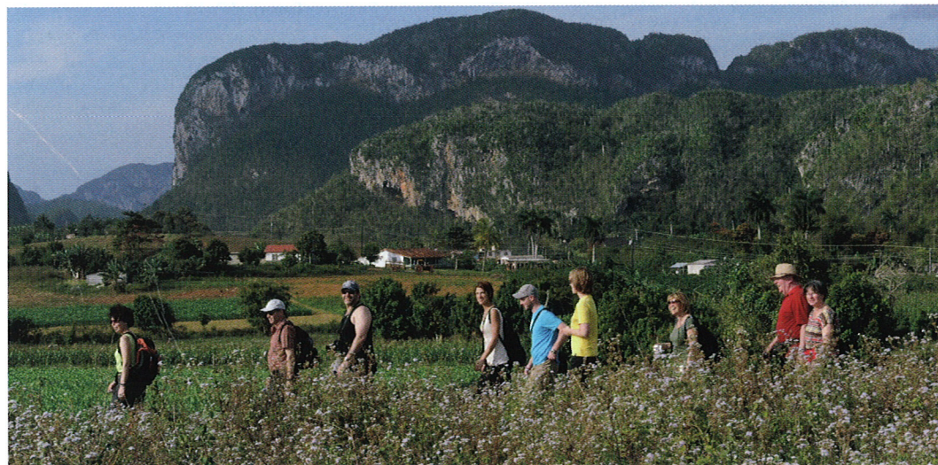
Wandergruppe unterwegs im Tal von Viñales

IMBACH-Reiseleiter stellt seine Heimat vor!