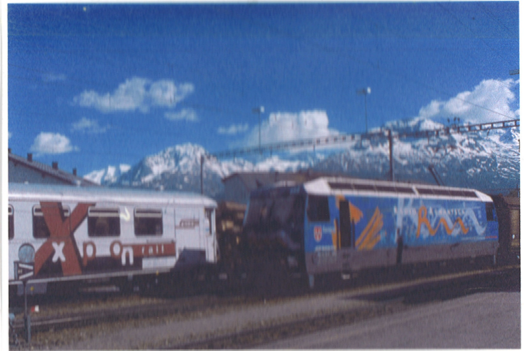
RhB-Forum RAIL EXPO Bhf. Samedan