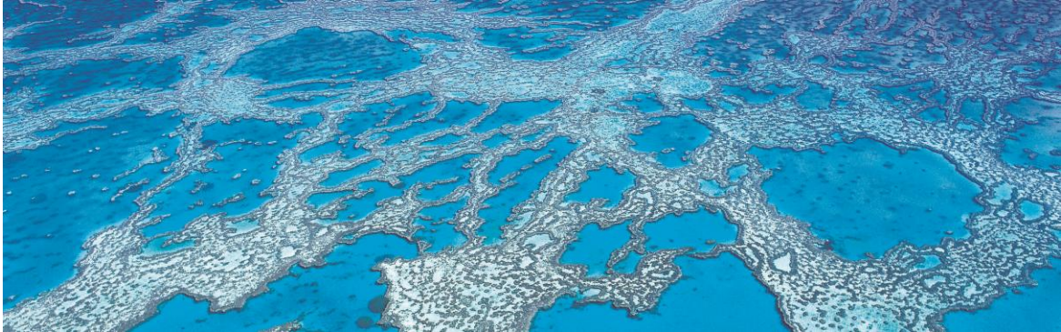
Das Great Barrier Reef in Australien