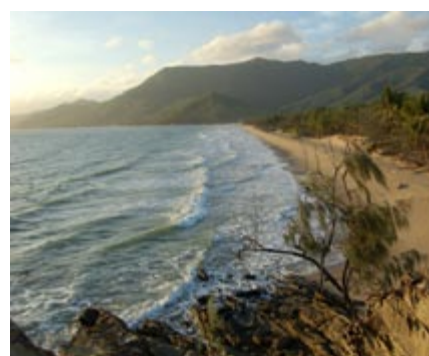
Der Traumstrand beim Thala Beach Resort, Halbinsel Cook, im Norden von Queensland.