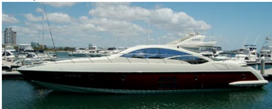
Jacht bei Surfers Paradise.

Das farbenprächtigt schillernde Great Barrier Reef, das sich auf über 2300 Kilometern vor der Ostküste Australiens bis fast nach Papua Neuguinea erstreckt, ist das