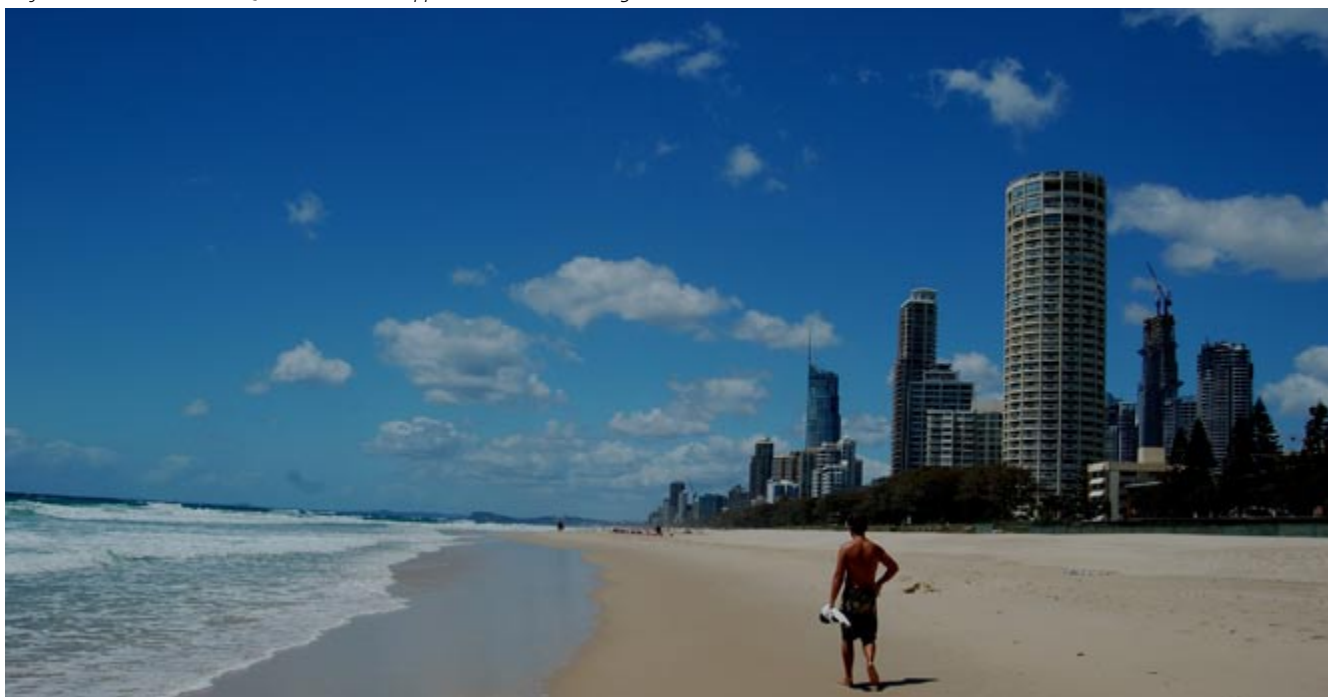
Surfers Paradise, Gold Coast, Queensland. Hohe Appartmenthäuser an langem Strand.

Das Hinterland der Gold Coast hingegen beeindruckt durch Regenwälder wie den Lamington-Nationalpark und den Scenic Mountain Rim. Dort liegt die «Peppers Spicers Peak Lodge». Sie ist das Prunkstück des Gliedstaates Queensland und wurde 2006 als «beste luxuriöse Unterkunft» und in den vergangenen zwei Jahren auch als «bestes Gourmet-Restaurant von Queensland» ausgezeichnet. Auf 1130 Meter Höhe gelegen auf der Lichtung einer Bergflanke