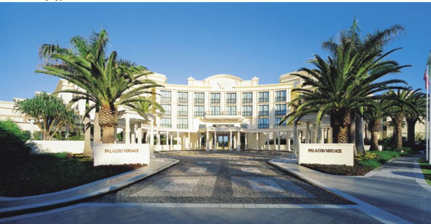
Eingangsfrent des Versace Hotels.

tet. Das «Beach Club» ist Hamilton Islands luxuriösestes Bijou.