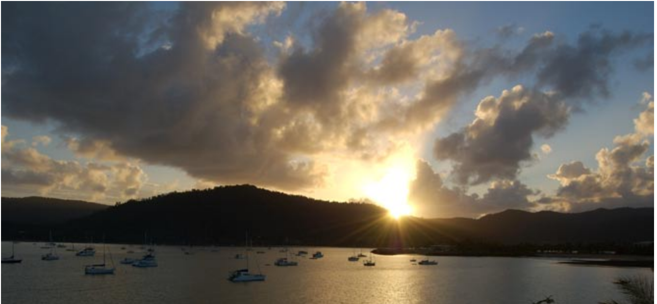
Airlie Beach bei Sonnenuntergang.