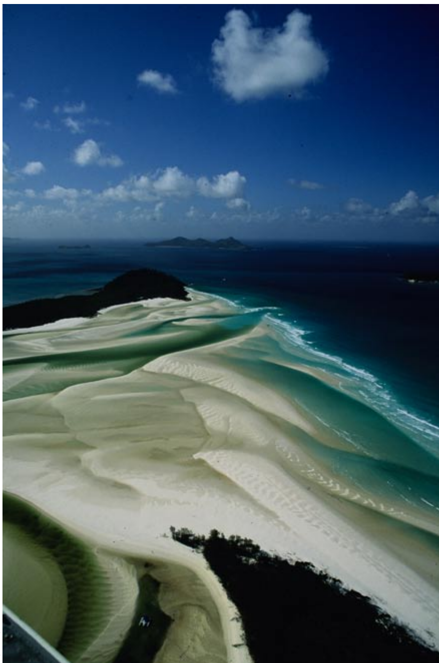
Die atemberaubenden Strände der Whitsunday Islands. Hill Inlet.

weltweit größte lebende Bauwerk der Natur. 1900 einzelne Korallenriffe beherbergen rund 400 Korallen- und über 1500 Fischarten. Die in Küstennähe liegenden Whitsunday Islands bestehen aus 74 Inseln, von denen acht bewohnt und mit Resorts versehen, während die anderen Inseln unberührtes Nationalparkgebiet sind. Vor der Eiszeit gehörten die Inseln zum Festland, doch der Anstieg des Meeresspiegels nach der Eiszeit ließ dieses begeisternde Inselparadies erst entstehen. Wären die Inseln nicht geschützt, hätten die Reichen dieser Welt längst alle in Beschlag genommen und privatisiert. Zu den wohl bekanntesten Urlaubsinseln zählt Hamilton Island, das durch einen eigenen Flughafen gut erschlossen ist. Das gediegenste Resort-Hotel, das «Beach Club», liegt zu Füßen des gigantischen Vierstern-Hotelkastens namens «Reef View», der die Insel verschandelt, aber eine schöne Aussicht auf die Lagune und die Inselwelt bietet. Zudem gibt es auch Apartments und eine Reihe privater Luxusvillen, die an Betuchte vermietet werden. Hamilton Island ist nebst dem Festlandort Arlie Beach Ausgangspunkt für ein Ausflug zum Great Barrier Reef oder für einen Abstecher zu den Whitsunday Islands und bietet rund 30 Wassersportarten sowie einen Golfplatz an, der vom fünffachen British-Open-Gewinner Peter Thompson kreiert wurde von von jedem Loch aus einen herrlichen Ausblick auf die Inselwelt bie-