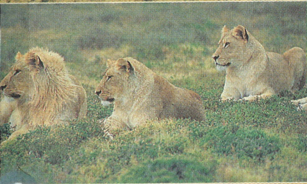
Die wilde und unberührte Landschaft des Deltas ist Heimat für viele Tiere. Der Mensch ist hier nur als Zuschauer am Rand geduldet.

Zeltlagern oder im Freien, um möglichst viel über das Leben im Busch zu erfahren. Unsere Reiseleiterin spart nicht mit Ratschlägen über das Verhalten in der Wildnis: grösste Aufmerksamkeit, behutsames Umherlaufen und in Rufweite bleiben.