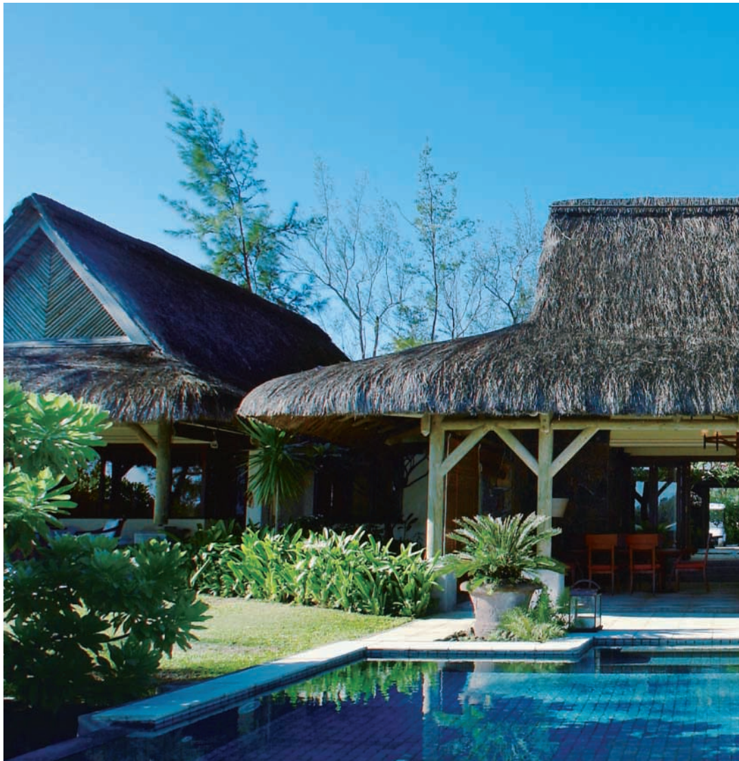
Oben: Gourmets kommen in beiden Hotels auf ihre Rechnung.